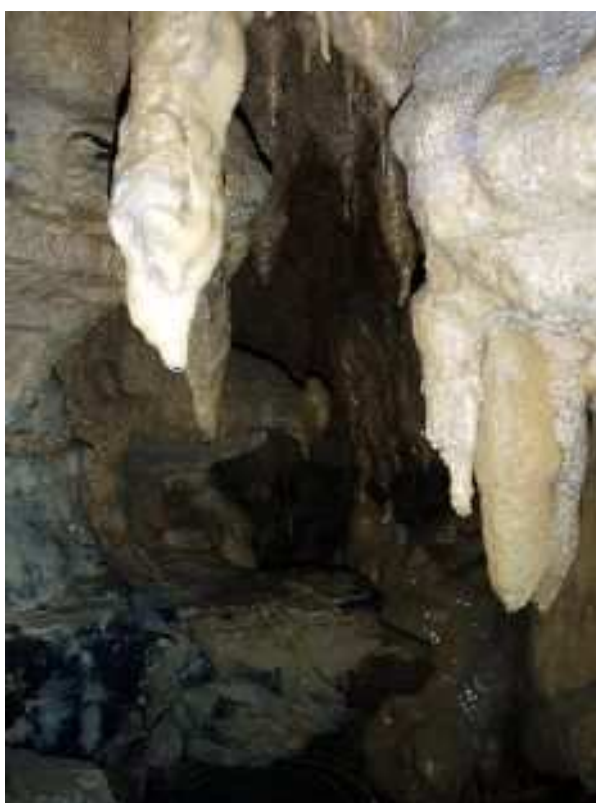
Tanna da' Scaggia - meandro