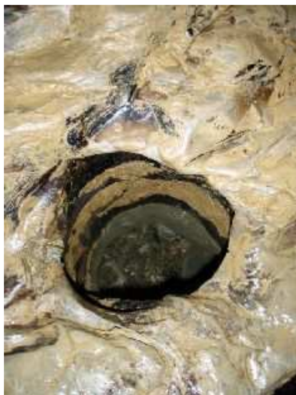
Tanna da' Scaggia - marmitta nel pavimento di roccia impermeabile