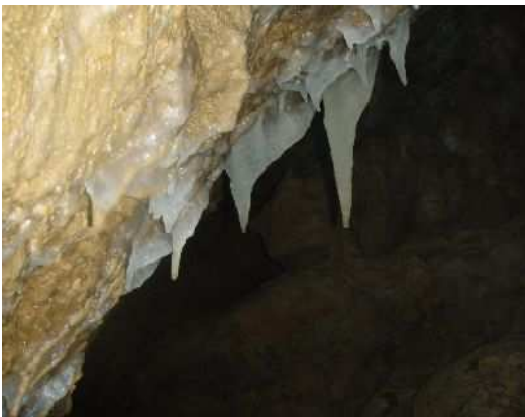
Tanna da' Scaggia – piccole stallattiti