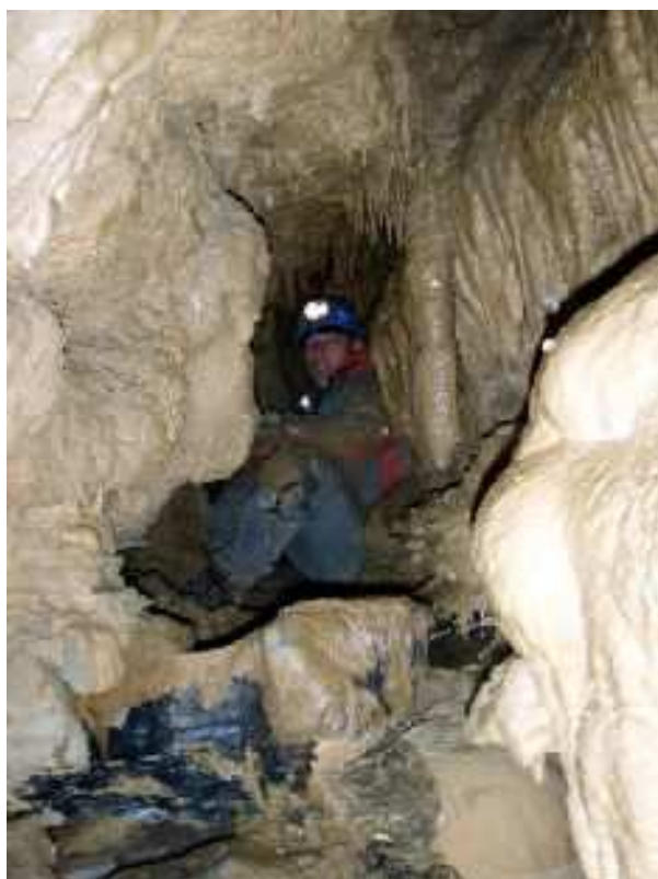
Tanna da' Scaggia - tratto oltresifone