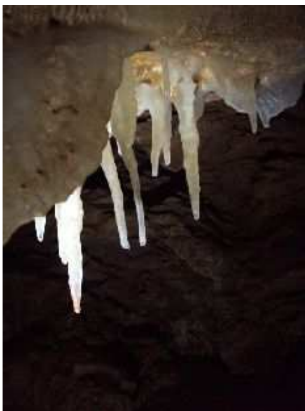
Tanna da' Scaggia - stallattiti di calcite nel nuovo tratto