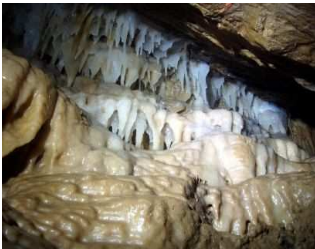
Tanna da' Scaggia - organo